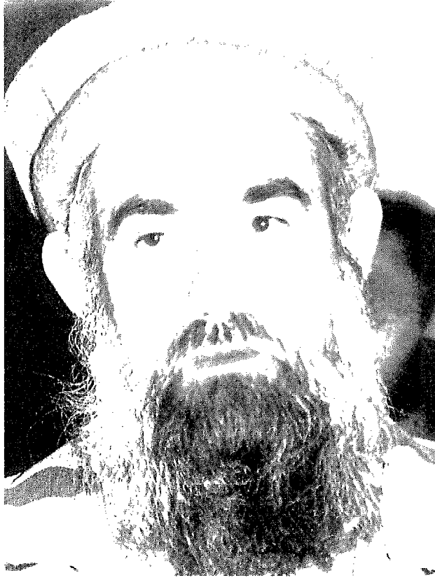
عبد الله عزام في آخر أيامه .